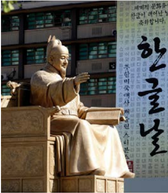
올해 한글주간 행사는 한글을 만든 세종대왕의 업적을 기리고 한글이 가지고 있는 소용과 어울림의 가치를 자유롭게 느낄 수 있게 하자는 취지에서 기획했다. 사진은 서울 광화문공장의 세종대왕 동상.